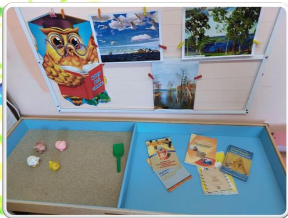
«Чудо – песочница»